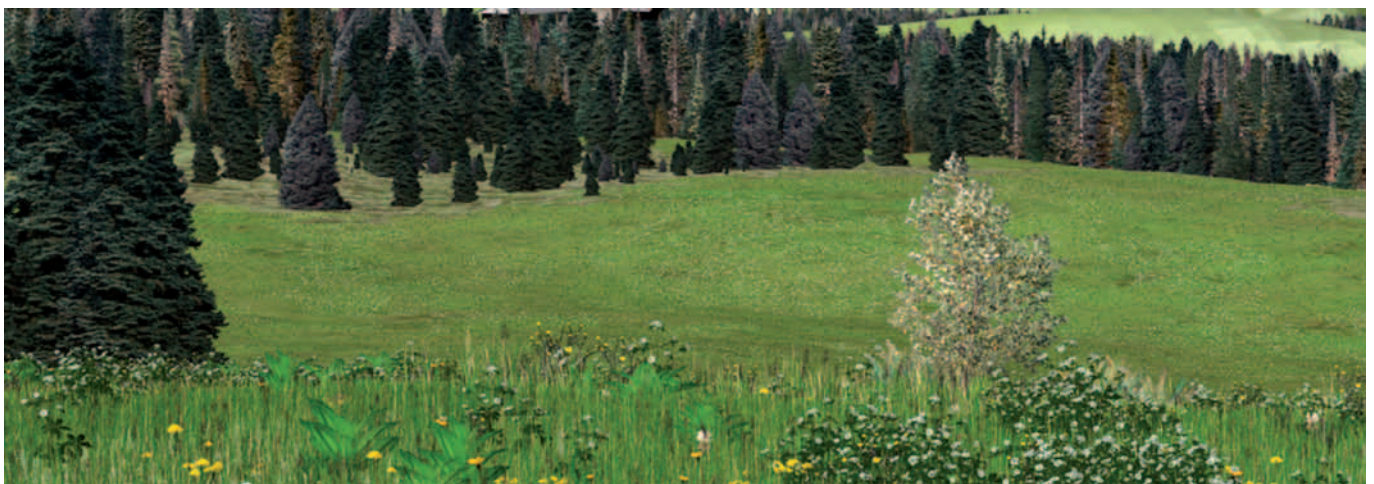
Abb. 2. Realistische 3D Visualisierung die eine mögliche Entwicklung eines wechselfeuchten Flachmooses bei Nutzungsaufgabe mit Hilfe von Zeigerpflanzen (z. B. Veratrum album und Ranunculus acontifolius ) demonstriert.

Werden realistische 3D Visualisierungen eingesetzt, können Bewertungen auf zwei Ebenen stattfinden. Zum einen können die realistischen Visualisierungen dazu dienen, die theoretischen Annahmen hinter der aufgezeigten Landschaftsentwicklung in intuitiver Weise zu überprüfen. So wird zum Beispiel auch praktisches Erfahrungswissen in die Bewertung mit eingebunden. Zum anderen kann auch eine Abschätzung der Qualität von Vegetationszuständen oder Standorten anhand der Visualisierung erfolgen. Indikatoren zur Unterstützung dieser Bewertung können zum Beispiel in Form von Zeigerarten in der Vegetationsdarstellung (Abb. 2) oder als Farbschema-